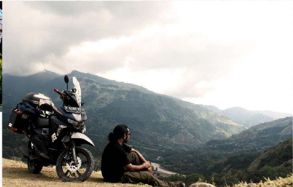
Wisata Perbukitan Enrekang, Sulawesi Selatan.