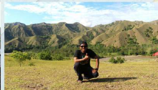
Area camping di Ollon, salah satu wisata andalan di Sulawesi Selatan.