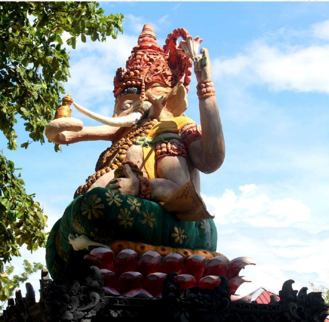
Ornamen khas Bali yang berada di pantai Bone-Bone.