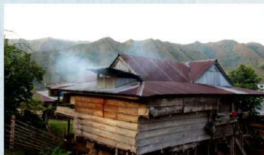
Rumah sederhana warga Ollon, Sulawesi Selatan.