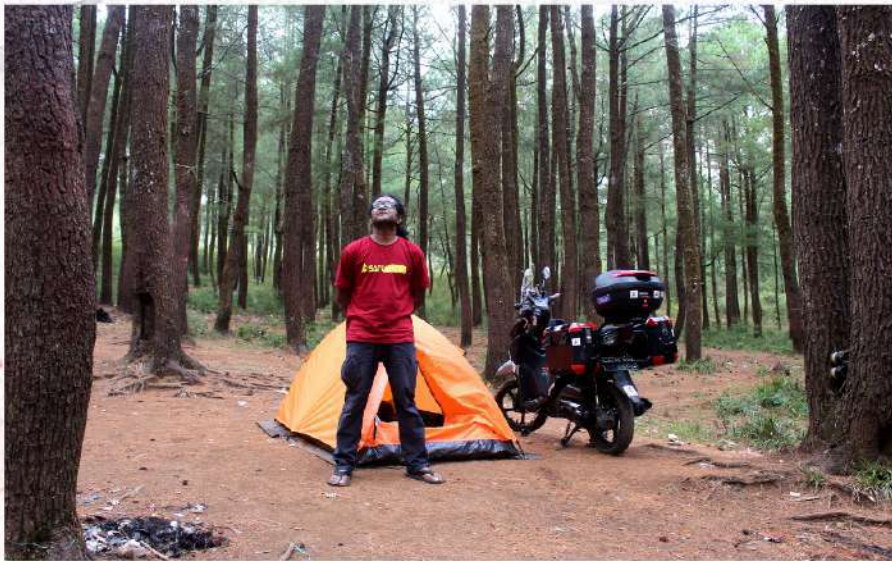
Area camping di bawah kaki Gunung Bawakaraeng, Malino, Sulawesi Selatan.