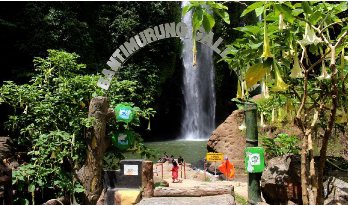
Air Terjun Bantimurung Galang, Gowa, Sulawesi Selatan.