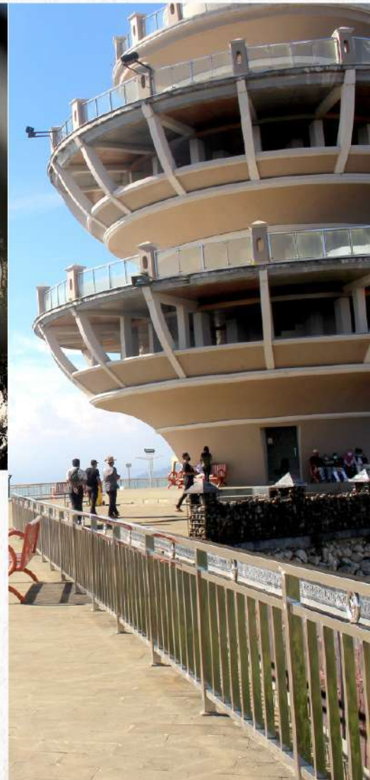
Area Patung Yesus Memberkati Buntu Burake sangat luas dan selalu menjadi tujuan wisata semua masyarakat dari berbagai kalangan dan latar belakang agama.