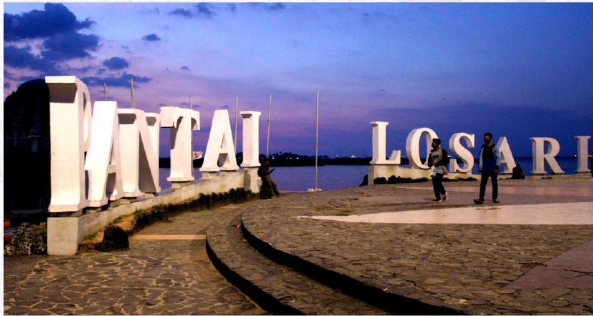
Pantai Losari kota Makassar, Sulawesi Selatan.