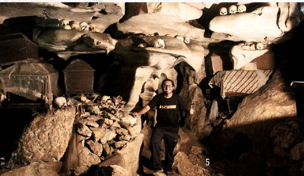
Makam batu Londa, Tana Toraja, Sulawesi Selatan.