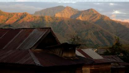
Rumah penduduk Ollon, Sulawesi Selatan.