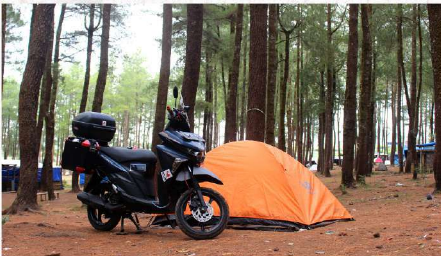
Keindahan Hutan Pinus Lembanna, Malino, Sulawesi Selatan.