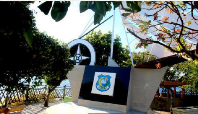
Titik 0 paling selatan Sulawesi, Pantai Bira.