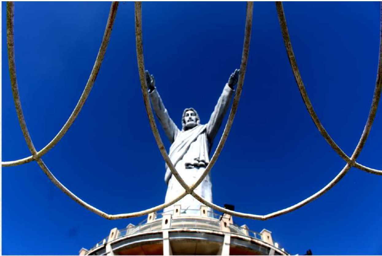
Patung Yesus Memberkati Buntu Burake, Makale, Sulawesi Selatan